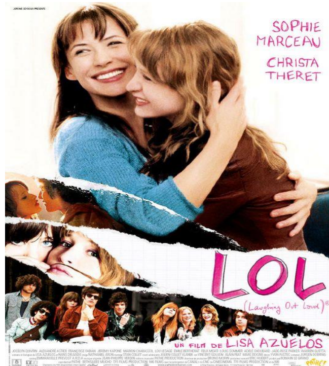
LOL, de Lisa Azuelos (2009)